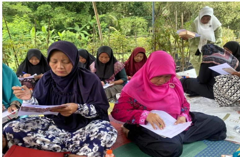
Gambar 2. Pelatihan

Melalui hasil terukur ini, KWT Kabese terbukti telah berhasil melewati fase transisi dari manajemen tradisional menuju manajemen semi-profesional. Antusiasme yang konsisten ditunjukkan oleh para peserta mengindikasikan bahwa keterlibatan kaum perempuan dalam pembangunan pertanian tidak hanya terbatas pada aspek produksi atau bercocok tanam semata, melainkan juga merambah pada aspek strategis seperti pengambilan keputusan kelompok berbasis data keuangan yang valid. Dengan kepemilikan keterampilan manajerial yang baru ini, daya saing produk olahan KWT Kabese di pameran-pameran produk pertanian diharapkan dapat meningkat secara kontinu, sekaligus menjadi percontohan yang menginspirasi bagi kelompok-kelompok wanita tani lainnya di wilayah Kabupaten Polewali Mandar.