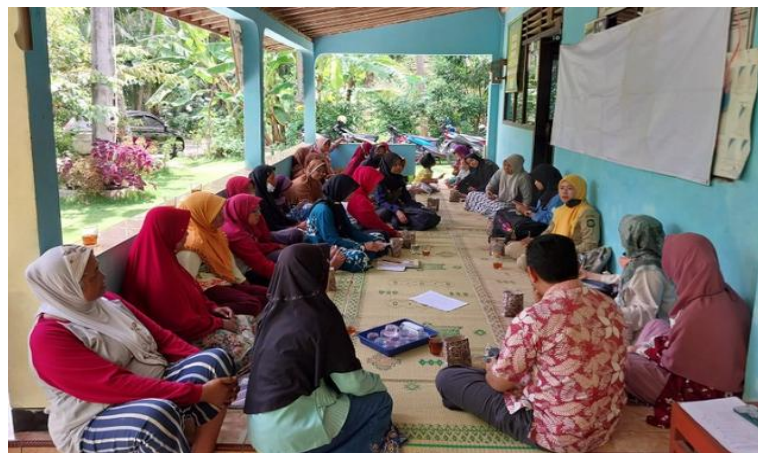
Gambar 3. Pelatihan