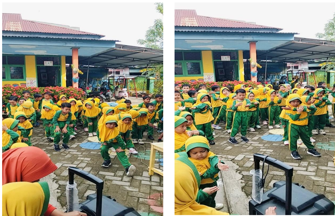
Gambar 2. Pelaksanaan Senam Ceria di halaman Sekolah TK Aisyiyah Bustanul Athfal