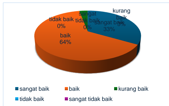
Gambar 1 Partisipasi anggota (X)