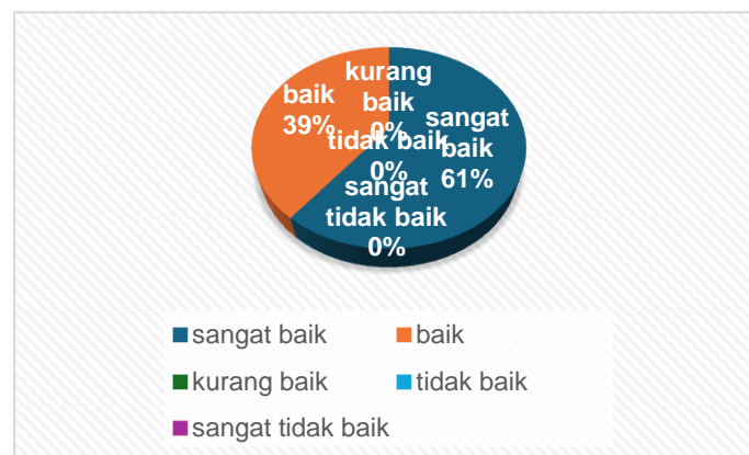
Gambar 2 Penerimaan SHU (Y)

Gambar di atas menunjukkan penilaian responden terhadap partisipasi anggota (X), secara keseluruhan rata-rata menunjukkan kriteria yang baik yaitu 64%, sedangkan yang menjawab sangat baik yaitu 33% dan yang menjawab kurang bagus yaitu 3% dan tidak ada yang menjawab tidak baik dan sangat tidak baik.